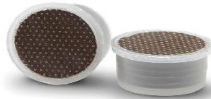
capsule di plastica svuotate