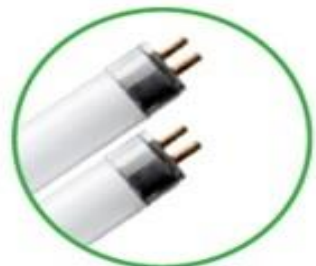
Tubi al neon