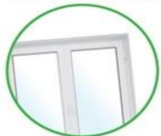
Vetri di finestre, finestrini di auto, vetri di fari e fanali