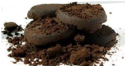
fondi di caffè