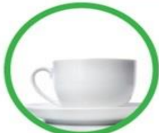
Oggetti in ceramica e porcellana