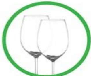
Oggetti in cristallo (bicchieri, lampadari, centrotavola, etc.)

C'è vetro e vetro. Perché alcuni oggetti, che istintivamente butteremmo nell'apposito contenitore per la raccolta del vetro, hanno in realtà un'altra destinazione. Eccoli: