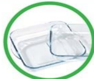
Contenitori in vetroceramica (pyrex, etc.)