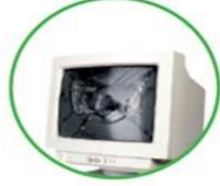
Tubi del televisore e schermi di tv, computer, monitor