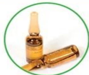
Confezioni in vetro dei farmaci usati