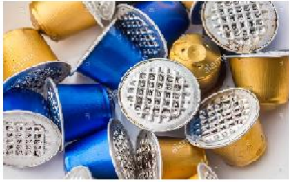
capsule di alluminio svuotate