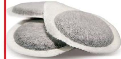
cialde in carta